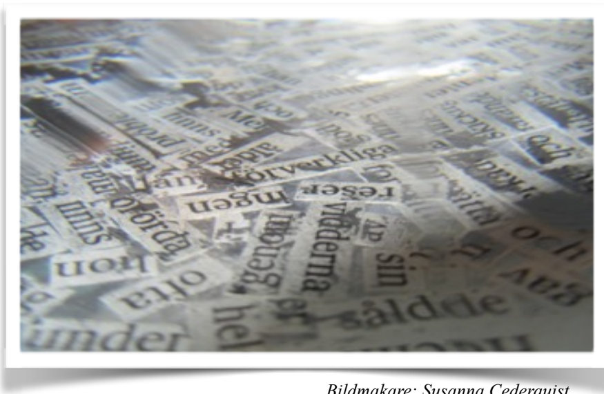
Bildmakare: Susanna Cederquist